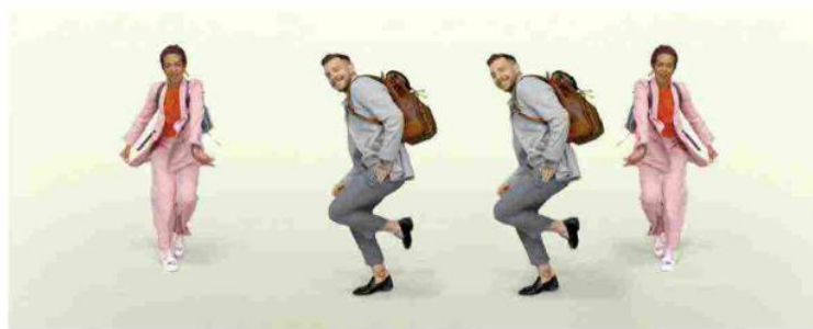
Videozone è la prima casa di produzione e post produzione italiana che utilizza la Virtual Production. Sopra, un frame dello spot web realizzato per Scharlau; a destra, lo spot Tv di Hyundai.